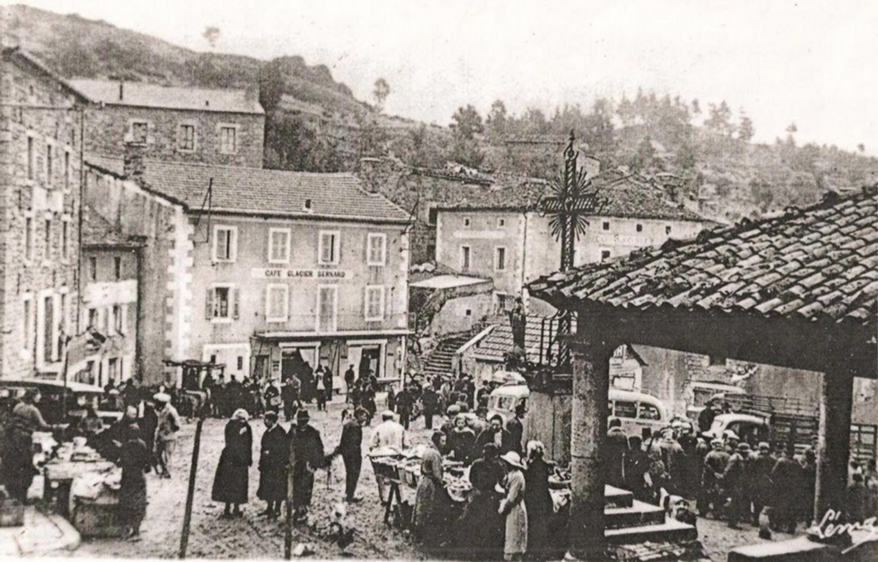
11236. Auroux (Lozère), alt. 950 m., cure d'air — La Place un jour de Marché

“ Si la chaleur persiste, cela nous évitera le verglas. ” - Pierre Dac